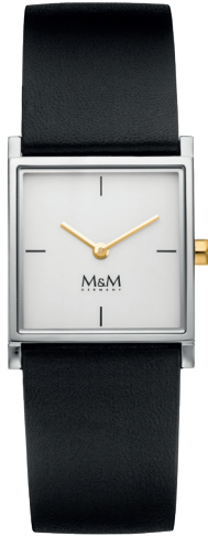
Referenz: M11974-462 Größe: 21x21mm Uhrwerk: Quarz Gehäuse: Edelstahl, poliert, bicolor Band: Leder, schwarz Zifferblatt: silber Wasserdicht: 3 ATM UVP: 159,00 Euro