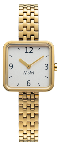
Referenz: M11951-233 Größe: 25x25 mm Uhrwerk: Quarz Gehäuse: Edelstahl, IP gold, poliert Band: Edelstahl, IP gold, poliert Zifferblatt: silber Wasserdicht: 3 ATM UVP: 198,00 Euro