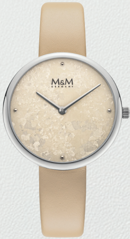
Referenz: M11978-542 Größe: Ø 34 mm Uhrwerk: Quarz Gehäuse: Edelstahl, poliert Band: Leder, beige Zifferblatt: crystal beige Wasserdicht: 3 ATM UVP: 159,00 Euro