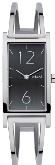
Referenz: M11918-048 Größe: 42 x 20 mm Uhrwerk: Quarz Gehäuse: Edelstahl, poliert Band: Edelstahl, Spange, poliert Zifferblatt: anthrazit Wasserdicht: 3 ATM UVP: 169,00 Euro