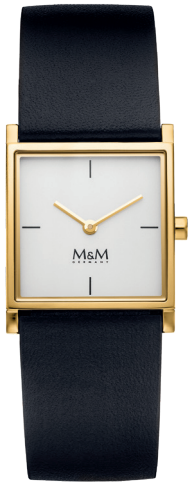
Referenz: M11974-432 Größe: 21x21mm Uhrwerk: Quarz Gehäuse: Edelstahl, IP gold, poliert Band: Leder, schwarz Zifferblatt: silber Wasserdicht: 3 ATM UVP: 169,00 Euro