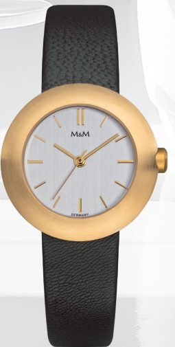
Referenz: M11948-412 Größe: Ø 32 mm Uhrwerk: Quarz Gehäuse: Edelstahl, IP gold, matt Band: Leder, schwarz Zifferblatt: silber Wasserdicht: 3 ATM UVP: 119,00 Euro