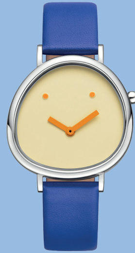
Referenz: M11968-942 Größe: Ø 36 mm Uhrwerk: Quarz Gehäuse: Edelstahl, poliert Band: Leder, blau Zifferblatt: Vanille Wasserdicht: 3 ATM UVP: 149,00 Euro