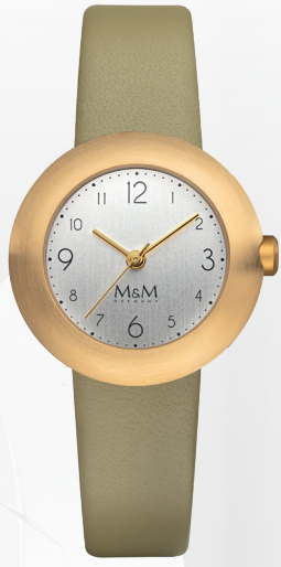
Referenz: M11948-913 Größe: Ø 32 mm Uhrwerk: Quarz Gehäuse: Edelstahl, IP gold, matt Band: Leder, olive Zifferblatt: silber Wasserdicht: 3 ATM UVP: 119,00 Euro