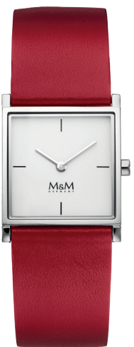
Referenz: M11974-742 Größe: 21x21mm Uhrwerk: Quarz Gehäuse: Edelstahl, poliert Band: Leder, rot Zifferblatt: silber Wasserdicht: 3 ATM UVP: 149,00 Euro