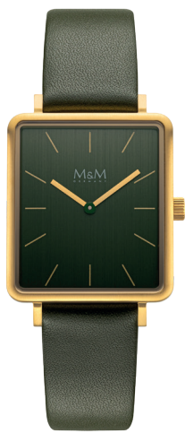
Referenz: M11977-516 Größe: 28x40 mm Uhrwerk: Quarz Gehäuse: Edelstahl, IP gold, matt Band: Leder, dunkelgrün Zifferblatt: dunkelgrün Wasserdicht: 3 ATM UVP: 169,00 Euro