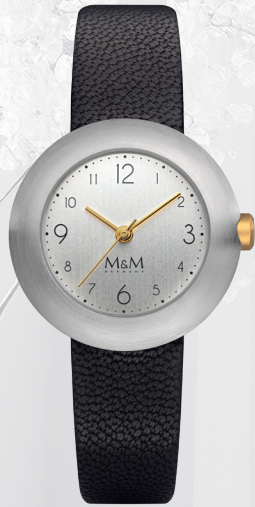
Referenz: M11948-463 Größe: Ø 32 mm Uhrwerk: Quarz Gehäuse: Edelstahl, bicolor, matt Band: Leder, schwarz Zifferblatt: silber Wasserdicht: 3 ATM UVP: 99,90 Euro