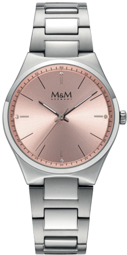
Referenz: M11972-148 Größe: Ø 36 mm Uhrwerk: Quarz Gehäuse: Edelstahl, matt/polirt Band: Edelstahl, matt/polirt Zifferblatt: rosa, mit Zirkoniasteinchen und mit Leuchtzeigern Wasserdicht: 3 ATM UVP: 179,00 Euro