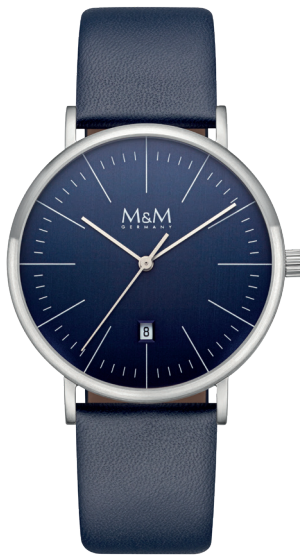
Referenz: M11970-828 Größe: Ø 40 mm Uhrwerk: Quarz Gehäuse: Edelstahl, matt Band: Leder, dunkelblau Zifferblatt: blau Wasserdicht 3 ATM UVP: 149,00 Euro