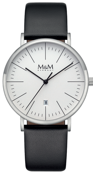
Referenz: M11970-422 Größe: Ø 40 mm Uhrwerk: Quarz Gehäuse: Edelstahl, matt Band: Leder, schwarz Zifferblatt: silber Wasserdicht 3 ATM UVP: 149,00 Euro