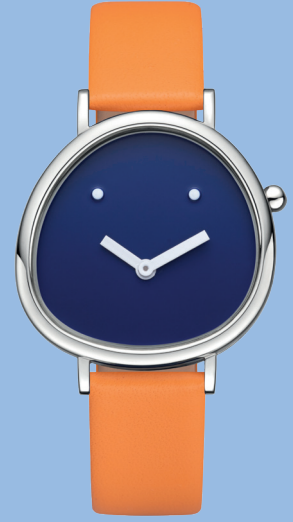
Referenz: M11968-745 Größe: Ø 36 mm Uhrwerk: Quarz Gehäuse: Edelstahl, poliert Band: Leder, orange Zifferblatt: dunkelblau Wasserdicht: 3 ATM UVP: 149,00 Euro