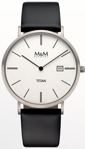
Referenz: M22200-422 Größe: Ø 40 mm Uhrwerk: Quarz Gehäuse: TITAN satin Band: Leder, schwarz Zifferblatt: silber Wasserdicht: 3 ATM UVP: 159,00 Euro