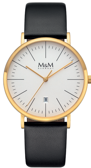
Referenz: M11970-412 Größe: Ø 40 mm Uhrwerk: Quarz Gehäuse: Edelstahl, IP gold, matt Band: Leder, schwarz Zifferblatt: silber Wasserdicht 3 ATM UVP: 159,00 Euro