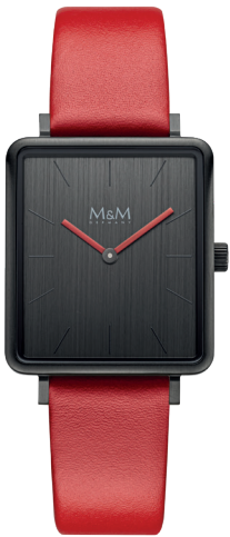
Referenz: M11977-685 Größe: 28x40 mm Uhrwerk: Quarz Gehäuse: Edelstahl, IP gun matt Band: Leder, rot Zifferblatt: anthrazit Wasserdicht: 3 ATM UVP: 169,00 Euro