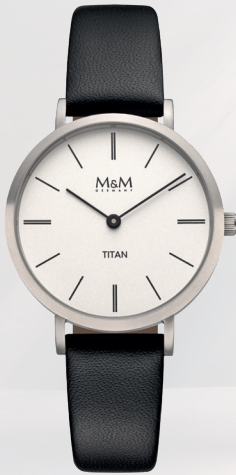
Referenz: M22201-422 Größe: Ø 31 mm Uhrwerk: Quarz Gehäuse: TITAN satin Band: Leder, schwarz Zifferblatt: silber Wasserdicht: 3 ATM UVP: 149,00 Euro