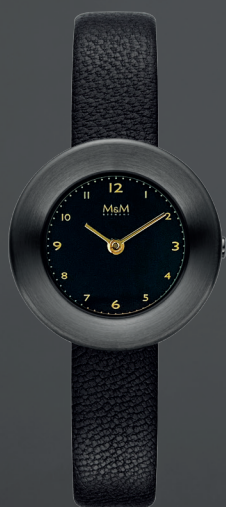
Referenz: M11966-484 Größe: Ø 29 mm Uhrwerk: Quarz Gehäuse: Edelstahl, IP gun, matt Band: Leder, schwarz Zifferblatt: schwarz Wasserdicht: 3 ATM UVP: 159,00 Euro