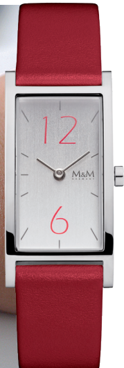
Referenz: M11918-743 Größe: 42 x 20 mm Uhrwerk: Quarz Gehäuse: Edelstahl, poliert Band: Leder, burgunder Zifferblatt: silber Wasserdicht: 3 ATM UVP: 139,00 Euro