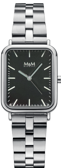
Referenz: M11969-145 Größe: 38 x 26 mm Uhrwerk: Quarzwerk Gehäuse: Edelstahl, poliert Band: Edelstahl, matt/poliert Zifferblatt: anthrazit Wasserdicht: 3 ATM UVP: 198,00 Euro