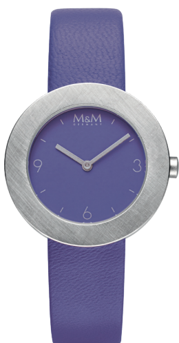
Referenz: M11959-424 Größe: Ø 34 mm Uhrwerk: Quarz Gehäuse: Edelstahl, kratzmatt Band: Leder, lavendel Zifferblatt: lavendel Wasserdicht: 3 ATM UVP: 119,00 Euro