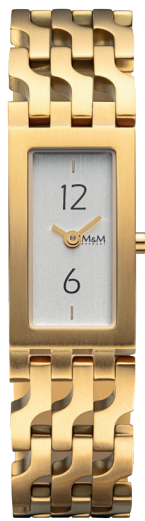
Referenz: M11967-213 Größe: 30 mm x 17 mm Uhrwerk: Quarz Gehäuse: Edelstahl, IP gold, matt Band: Edelstahl, IP gold, matt Zifferblatt: silber Wasserdicht: 3 ATM UVP: 298,00 Euro