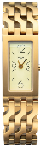
Referenz: M11967-219 Größe: 30 x 17 mm Uhrwerk: Quarzwerk Gehäuse: Edelstahl, IP gold, matt Band: Edelstahl, IP gold, matt Zifferblatt: creme Wasserdicht: 3 ATM UVP: 298,00 Euro