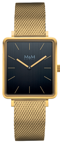
Referenz: M11977-215 Größe: 28x40 mm Uhrwerk: Quarz Gehäuse: Edelstahl, IP gold, matt Band: Milanaise, IP gold Zifferblatt: schwarz Wasserdicht: 3 ATM UVP: 179,00 Euro