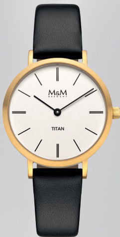
Referenz: M22201-412 Größe: Ø 31 mm Uhrwerk: Quarz Gehäuse: TITAN satin, IP gold Band: Leder, schwarz Zifferblatt: silber Wasserdicht: 3 ATM UVP: 159,00 Euro