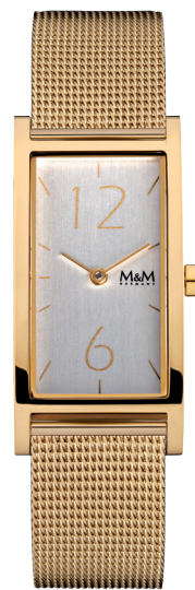
Referenz: M11918-233 Größe: 42 x 20 mm Uhrwerk: Quarz Gehäuse: Edelstahl, IP gold, poliert Band: Milanaiseseband, IP gold Zifferblatt: silber Wasserdicht: 3 ATM UVP: 159,00 Euro