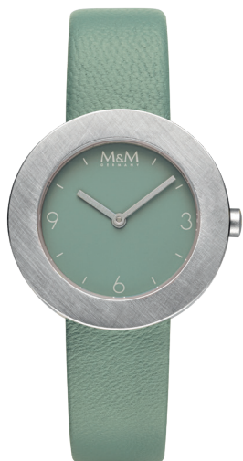
Referenz: M11959-528 Größe: Ø 34 mm Uhrwerk: Quarz Gehäuse: Edelstahl, kratzmatt Band: Leder, dusty-mint Zifferblatt: dusty-mint Wasserdicht: 3 ATM UVP: 119,00 Euro