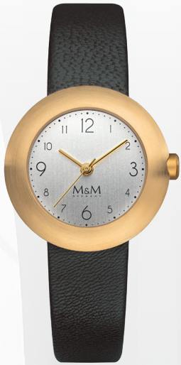
Referenz: M11948-413 Größe: Ø 32 mm Uhrwerk: Quarz Gehäuse: Edelstahl, IP gold, matt Band: Leder, schwarz Zifferblatt: silber Wasserdicht: 3 ATM UVP: 119,00 Euro