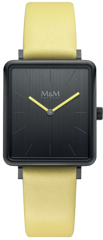
Referenz: M11977-085 Größe: 28x40 mm Uhrwerk: Quarz Gehäuse: Edelstahl, IP gun matt Band: Leder, gelb Zifferblatt: anthrazit Wasserdicht: 3 ATM UVP: 169,00 Euro