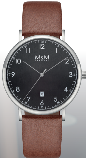
Referenz: M11970-625 Größe: Ø 40 mm Uhrwerk: Quarz Gehäuse: Edelstahl, matt Band: Leder, braun Zifferblatt: anthrazit Wasserdicht 3 ATM UVP: 149,00 Euro