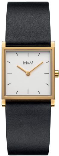
Referenz: M11974-433 Größe: 21x21mm Uhrwerk: Quarz Gehäuse: Edelstahl, IP gold, poliert Band: Leder, schwarz Zifferblatt: silber Wasserdicht: 3 ATM UVP: 169,00 Euro