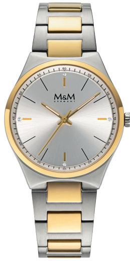
Referenz: M11972-362 Größe: Ø 36 mm Uhrwerk: Quarz Gehäuse: Edelstahl, matt/polirt, bicolor Band: Edelstahl, matt/polirt, bicolor Zifferblatt: silber, mit Zirkoniasteinchen und mit Leuchtzeigern Wasserdicht: 3 ATM UVP: 189,00 Euro