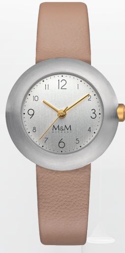
Referenz: M11948-563 Größe: Ø 32 mm Uhrwerk: Quarz Gehäuse: Edelstahl, bicolor, matt Band: Leder, iced Coffee Zifferblatt: silber Wasserdicht: 3 ATM UVP: 99,90 Euro