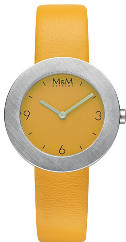
Referenz: M11959-020 Größe: Ø 34 mm Uhrwerk: Quarz Gehäuse: Edelstahl, kratzmatt Band: Leder, mango Zifferblatt: mango Wasserdicht: 3 ATM UVP: 119,00 Euro