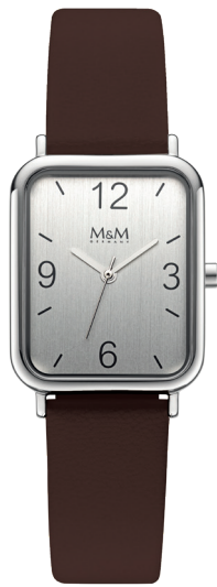
Referenz: M11969-547 Größe: 38 x 26 mm Uhrwerk: Quarzwerk Gehäuse: Edelstahl, matt Band: Leder, schokobraun Zifferblatt: silber Wasserdicht: 3 ATM UVP: 149,00 Euro