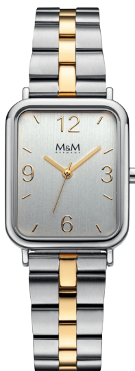
Referenz: M11969-363 Größe: 38 x 26 mm Uhrwerk: Quarzwerk Gehäuse: Edelstahl, bicolor, poliert Band: Edelstahl, bicolor, matt/poliert Zifferblatt: silber Wasserdicht: 3 ATM UVP: 219,00 Euro