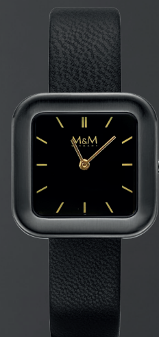
Referenz: M11965-484 Größe: 32 x 32 mm Uhrwerk: Quarz Gehäuse: Edelstahl, IP gun, matt Band: Leder, schwarz Zifferblatt: schwarz Wasserdicht: 3 ATM UVP: 179,00 Euro