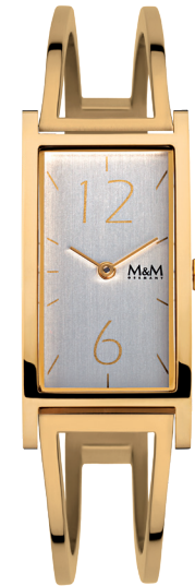
Referenz: M11918-033 Größe: 42 x 20 mm Uhrwerk: Quarz Gehäuse: Edelstahl, poliert Band: Edelstahl, Spange, IP Gold, poliert Zifferblatt: silber Wasserdicht: 3 ATM UVP: 179,00 Euro