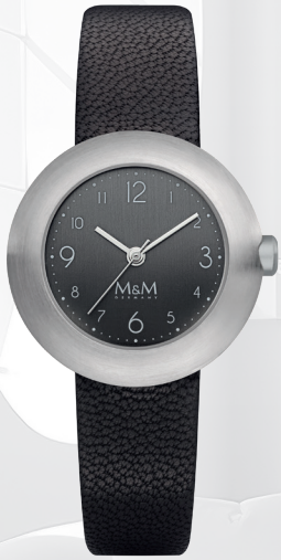
Referenz: M11948-426 Größe: Ø 32 mm Uhrwerk: Quarz Gehäuse: Edelstahl, matt Band: Leder, schwarz Zifferblatt: anthrazit Wasserdicht: 3 ATM UVP: 99,90 Euro