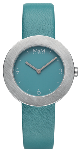
Referenz: M11959-525 Größe: Ø 34 mm Uhrwerk: Quarz Gehäuse: Edelstahl, kratzmatt Band: Leder, sage Zifferblatt: sage Wasserdicht: 3 ATM UVP: 119,00 Euro