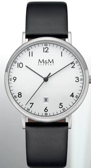
Referenz: M11970-423 Größe: Ø 40 mm Uhrwerk: Quarz Gehäuse: Edelstahl, matt Band: Leder, schwarz Zifferblatt: silber Wasserdicht 3 ATM UVP: 149,00 Euro