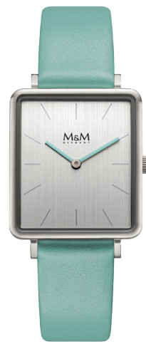
Referenz: M11977-822 Größe: 28x40 mm Uhrwerk: Quarz Gehäuse: Edelstahl, poliert Band: Leder, türkis Zifferblatt: silber Wasserdicht: 3 ATM UVP: 159,00 Euro