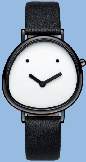
Referenz: M11968-482 Größe: Ø 36 mm Uhrwerk: Quarz Gehäuse: Edelstahl, IP black, poliert Band: Leder, schwarz Zifferblatt: weiss Wasserdicht: 3 ATM UVP: 159,00 Euro