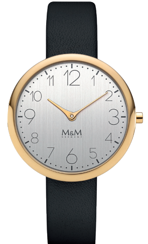
Referenz: M11944-432 Größe: Ø 34 mm Uhrwerk: Quarzwerk Gehäuse: Edelstahl, IP gold, poliert Band: Leder, schwarz Zifferblatt: silber Wasserdicht: 3 ATM UVP: 149,00 Euro