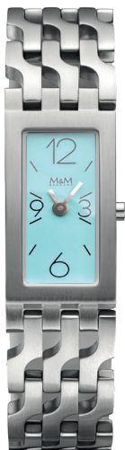
Referenz: M11967-127 Größe: 30 x 17 mm Uhrwerk: Quarzwerk Gehäuse: Edelstahl, matt Band: Edelstahl, matt Zifferblatt: aqua Wasserdicht: 3 ATM UVP: 279,00 Euro