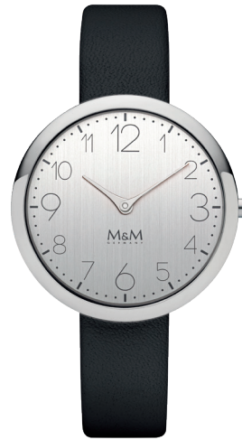
Referenz: M11944-443 Größe: Ø 34 mm Uhrwerk: Quarzwerk Gehäuse: Edelstahl, poliert Band: Leder, schwarz Zifferblatt: silber Wasserdicht: 3 ATM UVP: 139,00 Euro