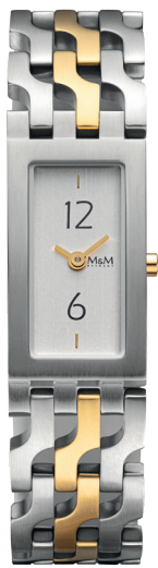
Referenz: M11967-353 Größe: 30 mm x 17 mm Uhrwerk: Quarz Gehäuse: Edelstahl, bicolor, matt Band: Edelstahl, bicolor, matt Zifferblatt: silber Wasserdicht: 3 ATM UVP: 298,00 Euro