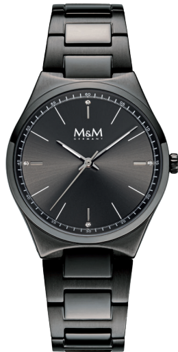
Referenz: M11972-885 Größe: Ø 36 mm Uhrwerk: Quarz Gehäuse: Edelstahl, IP gun, matt/polirt Band: Edelstahl, IP gun, matt/polirt Zifferblatt: anthrazit, mit Zirkoniasteinchen und mit Leuchtzeigern Wasserdicht: 3 ATM UVP: 198,00 Euro