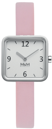
Referenz: M11951-643 Größe: 25x25 mm Uhrwerk: Quarz Gehäuse: Edelstahl, poliert Band: Leder, rosa Zifferblatt: silber Wasserdicht: 3 ATM UVP: 149,00 Euro