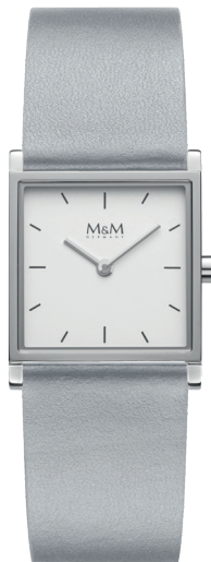
Referenz: M11974-843 Größe: 21x21mm Uhrwerk: Quarz Gehäuse: Edelstahl, poliert Band: Leder, grau Zifferblatt: silber Wasserdicht: 3 ATM UVP: 159,00 Euro