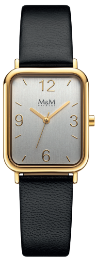
Referenz: M11969-433 Größe: 38 x 26 mm Uhrwerk: Quarzwerk Gehäuse: Edelstahl, IP gold poliert Band: Leder, schwarz Zifferblatt: silber Wasserdicht: 3 ATM UVP: 159,00 Euro