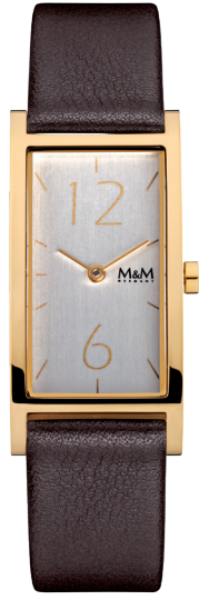
Referenz: M11918-533 Größe: 42 x 20 mm Uhrwerk: Quarz Gehäuse: Edelstahl, IP gold, poliert Band: Leder, dunkelbraun Zifferblatt: silber Wasserdicht: 3 ATM UVP: 149,00 Euro