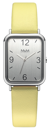
Referenz: M11969-043 Größe: 38 x 26 mm Uhrwerk: Quarzwerk Gehäuse: Edelstahl, poliert Band: Leder, gelb Zifferblatt: silber Wasserdicht: 3 ATM UVP: 149,00 Euro