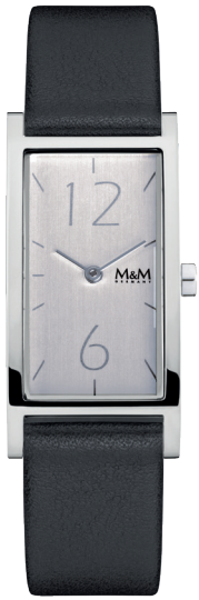
Referenz: M11918-443 Größe: 42 x 20 mm Uhrwerk: Quarz Gehäuse: Edelstahl, poliert Band: Leder, schwarz Zifferblatt: silber Wasserdicht: 3 ATM UVP: 139,00 Euro