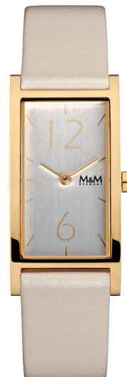
Referenz: M11918-933 Größe: 42 x 20 mm Uhrwerk: Quarz Gehäuse: Edelstahl, IP gold, poliert Band: Leder, beige Zifferblatt: silber Wasserdicht: 3 ATM UVP: 149,00 Euro