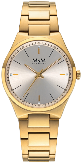
Referenz: M11972-232 Größe: Ø 36 mm Uhrwerk: Quarz Gehäuse: Edelstahl, IP gold, matt, poliert Band: Edelstahl, IP gold, matt, poliert Zifferblatt: silber, mit Zirkoniasteinchen und mit Leuchtzeigern Wasserdicht: 3 ATM UVP: 198,00 Euro