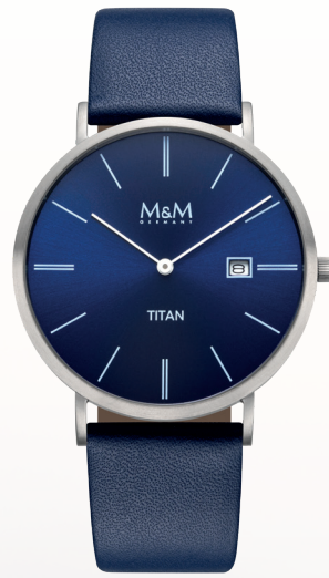
Referenz: M22200-828 Größe: Ø 40 mm Uhrwerk: Quarz Gehäuse: TITAN satin Band: Leder, blau Zifferblatt: blau, sunray Wasserdicht: 3 ATM UVP: 159,00 Euro