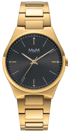
Referenz: M11972-235 Größe: Ø 36 mm Uhrwerk: Quarz Gehäuse: Edelstahl, IP gold, matt, poliert Band: Edelstahl, IP gold, matt, poliert Zifferblatt: anthrazit, mit Zirkoniasteinchen und mit Leuchtzeigern Wasserdicht: 3 ATM UVP: 198,00 Euro