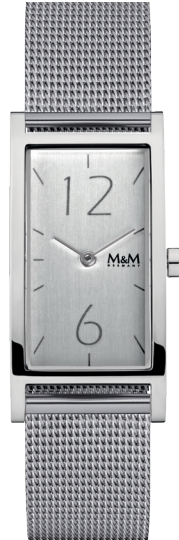
Referenz: M11918-143 Größe: 42 x 20 mm Uhrwerk: Quarz Gehäuse: Edelstahl, poliert Band: Milanaiseseband Zifferblatt: silber Wasserdicht: 3 ATM UVP: 149,00 Euro