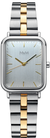
Referenz: M11969-362 Größe: 38 x 26 mm Uhrwerk: Quarzwerk Gehäuse: Edelstahl, bicolor, poliert Band: Edelstahl, bicolor, matt/poliert Zifferblatt: silber Wasserdicht: 3 ATM UVP: 219,00 Euro