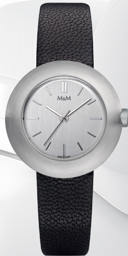
Referenz: M11948-422 Größe: Ø 32 mm Uhrwerk: Quarz Gehäuse: Edelstahl, matt Band: Leder, schwarz Zifferblatt: silber Wasserdicht: 3 ATM UVP: 99,90 Euro