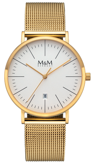
Referenz: M11970-212 Größe: Ø 40 mm Uhrwerk: Quarz Gehäuse: Edelstahl, IP gold, matt Band: Milanaisiband, IP gold Zifferblatt: silber Wasserdicht 3 ATM UVP: 169,00 Euro