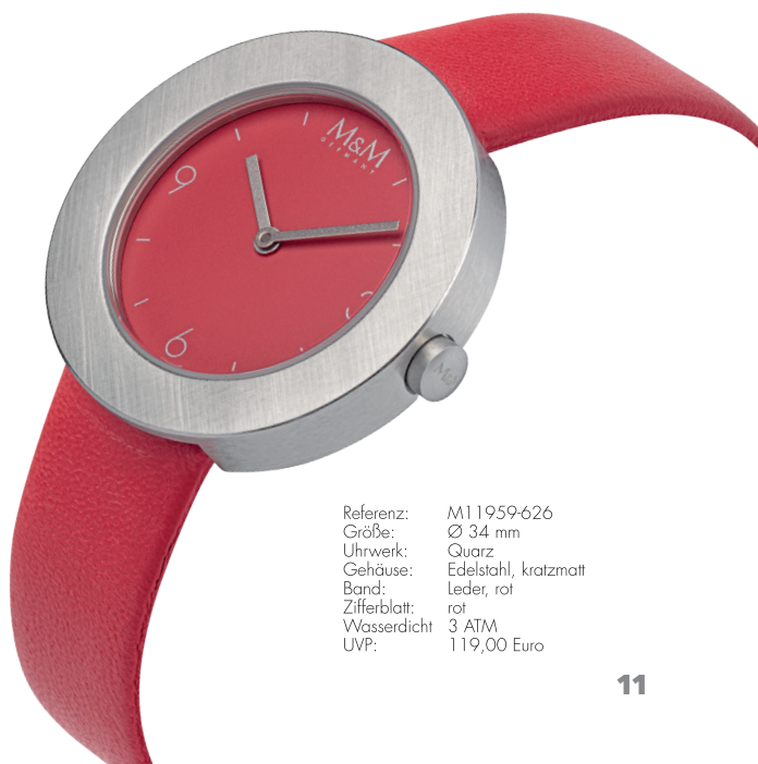
Referenz: M11959-626 Größe: Ø 34 mm Uhrwerk: Quarz Gehäuse: Edelstahl, kratzmatt Band: Leder, rot Zifferblatt: rot Wasserdicht: 3 ATM UVP: 119,00 Euro