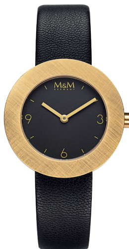
Referenz: M11959-416 Größe: Ø 34 mm Uhrwerk: Quarz Gehäuse: Edelstahl, IP gold, kratzmatt Band: Leder, schwarz Zifferblatt: schwarz Wasserdicht: 3 ATM UVP: 129,00 Euro