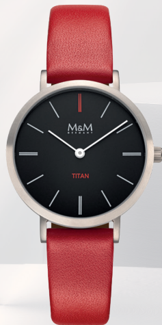
Referenz: M22201-615 Größe: Ø 31 mm Uhrwerk: Quarz Gehäuse: TITAN satin Band: Leder, rot Zifferblatt: schwarz Wasserdicht: 3 ATM UVP: 149,00 Euro