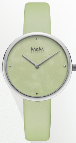
Referenz: M11978-848 Größe: Ø 34 mm Uhrwerk: Quarz Gehäuse: Edelstahl, poliert Band: Leder, mintgrün Zifferblatt: crystal mintgrün Wasserdicht: 3 ATM UVP: 159,00 Euro