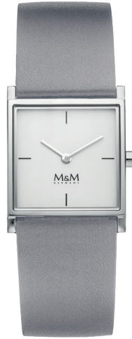
Referenz: M11974-842 Größe: 21x21mm Uhrwerk: Quarz Gehäuse: Edelstahl, poliert Band: Leder, grau Zifferblatt: silber Wasserdicht: 3 ATM UVP: 149,00 Euro