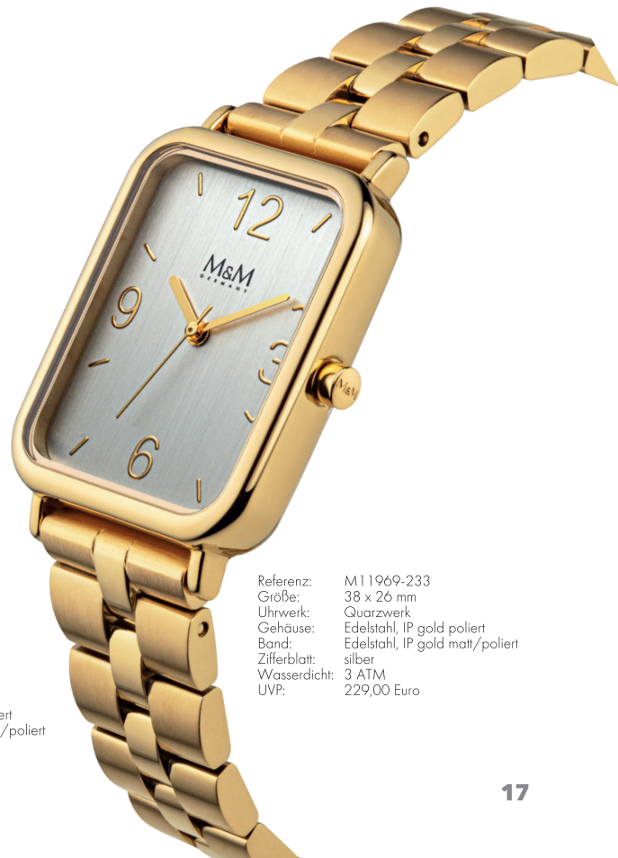
Referenz: M11969-233 Größe: 38 x 26 mm Uhrwerk: Quarzwerk Gehäuse: Edelstahl, IP gold poliert Band: Edelstahl, IP gold matt/poliert Zifferblatt: silber Wasserdicht: 3 ATM UVP: 229,00 Euro