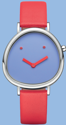
Referenz: M11968-648 Größe: Ø 36 mm Uhrwerk: Quarz Gehäuse: Edelstahl, poliert Band: Leder, rot Zifferblatt: flüder, rot Wasserdicht: 3 ATM UVP: 149,00 Euro