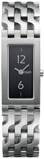
Referenz: M11967-125 Größe: 30 mm x 17 mm Uhrwerk: Quarz Gehäuse: Edelstahl, matt Band: Edelstahl, matt Zifferblatt: anthrazit Wasserdicht: 3 ATM UVP: 279,00 Euro