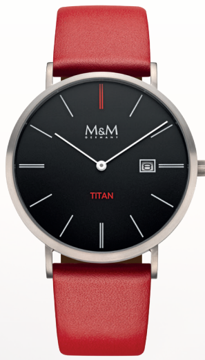
Referenz: M22200-615 Größe: Ø 40 mm Uhrwerk: Quarz Gehäuse: TITAN satin Band: Leder, rot Zifferblatt: schwarz Wasserdicht: 3 ATM UVP: 159,00 Euro