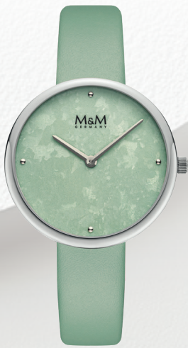
Referenz: M11978-646 Größe: Ø 34 mm Uhrwerk: Quarz Gehäuse: Edelstahl, poliert Band: Leder, aqua Zifferblatt: crystal aqua Wasserdicht: 3 ATM UVP: 159,00 Euro