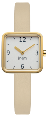
Referenz: M11951-733 Größe: 25x25 mm Uhrwerk: Quarz Gehäuse: Edelstahl, IP gold, poliert Band: Leder, beige Zifferblatt: silber Wasserdicht: 3 ATM UVP: 159,00 Euro