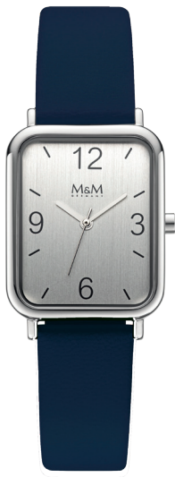
Referenz: M11969-847 Größe: 38 x 26 mm Uhrwerk: Quarzwerk Gehäuse: Edelstahl, matt Band: Leder, dunkelblau Zifferblatt: silber Wasserdicht: 3 ATM UVP: 149,00 Euro