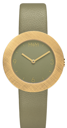
Referenz: M11959-919 Größe: Ø 34 mm Uhrwerk: Quarz Gehäuse: Edelstahl, IP gold, kratzmatt Band: Leder, olive Zifferblatt: olive Wasserdicht: 3 ATM UVP: 129,00 Euro