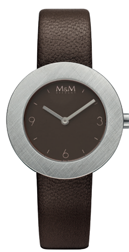
Referenz: M11959-527 Größe: Ø 34 mm Uhrwerk: Quarz Gehäuse: Edelstahl, kratzmatt Band: Leder, schokobraun Zifferblatt: schokobraun Wasserdicht: 3 ATM UVP: 119,00 Euro