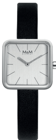
Referenz: M11951-442 Größe: 25x25 mm Uhrwerk: Quarz Gehäuse: Edelstahl, poliert, bicolor Band: Leder, schwarz Zifferblatt: silber Wasserdicht: 3 ATM UVP: 149,00 Euro