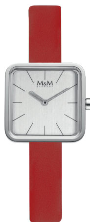
Referenz: M11951-842 Größe: 25x25 mm Uhrwerk: Quarz Gehäuse: Edelstahl, poliert Band: Leder, rot Zifferblatt: silber Wasserdicht: 3 ATM UVP: 149,00 Euro