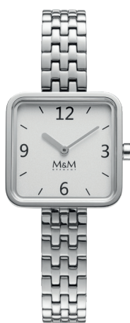
Referenz: M11951-143 Größe: 25x25 mm Uhrwerk: Quarz Gehäuse: Edelstahl, poliert Band: Edelstahl, poliert Zifferblatt: silber Wasserdicht: 3 ATM UVP: 189,00 Euro