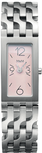
Referenz: M11967-128 Größe: 30 x 17 mm Uhrwerk: Quarzwerk Gehäuse: Edelstahl, matt Band: Edelstahl, matt Zifferblatt: rosa Wasserdicht: 3 ATM UVP: 279,00 Euro