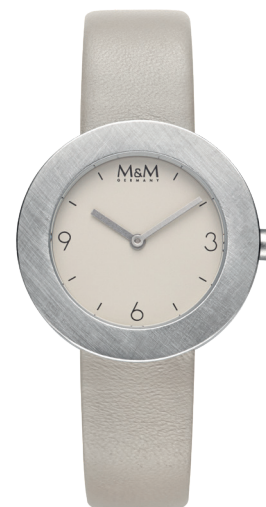
Referenz: M11959-727 Größe: Ø 34 mm Uhrwerk: Quarz Gehäuse: Edelstahl, kratzmatt Band: Leder, beige Zifferblatt: beige Wasserdicht: 3 ATM UVP: 119,00 Euro