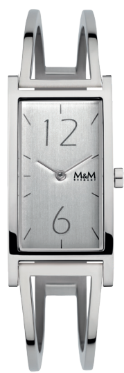
Referenz: M11918-043 Größe: 42 x 20 mm Uhrwerk: Quarz Gehäuse: Edelstahl, poliert Band: Edelstahl, Spange, poliert Zifferblatt: silber Wasserdicht: 3 ATM UVP: 169,00 Euro