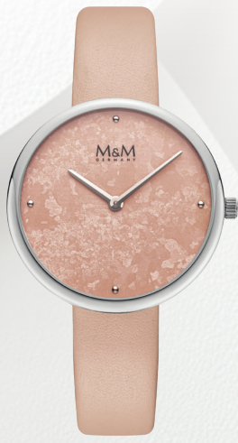
Referenz: M11978-747 Größe: Ø 34 mm Uhrwerk: Quarz Gehäuse: Edelstahl, poliert Band: Leder, rose Zifferblatt: crystal rose Wasserdicht: 3 ATM UVP: 159,00 Euro