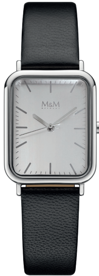
Referenz: M11969-442 Größe: 38 x 26 mm Uhrwerk: Quarzwerk Gehäuse: Edelstahl, poliert Band: Leder, schwarz Zifferblatt: silber Wasserdicht: 3 ATM UVP: 149,00 Euro