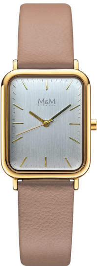
Referenz: M11969-933 Größe: 38 x 26 mm Uhrwerk: Quarzwerk Gehäuse: Edelstahl, IP gold, poliert Band: Leder, iced Coffee Zifferblatt: silber Wasserdicht: 3 ATM UVP: 159,00 Euro