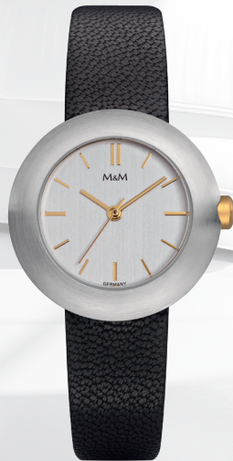
Referenz: M11948-452 Größe: Ø 32 mm Uhrwerk: Quarz Gehäuse: Edelstahl, matt, bicolor Band: Leder, schwarz Zifferblatt: silber Wasserdicht: 3 ATM UVP: 99,90 Euro