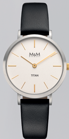
Referenz: M22201-452 Größe: Ø 31 mm Uhrwerk: Quarz Gehäuse: TITAN satin, bicolor Band: Leder, schwarz Zifferblatt: silber Wasserdicht: 3 ATM UVP: 149,00 Euro