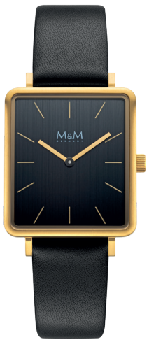
Referenz: M11977-415 Größe: 28x40 mm Uhrwerk: Quarz Gehäuse: Edelstahl, IP gold matt Band: Leder, schwarz Zifferblatt: schwarz Wasserdicht: 3 ATM UVP: 169,00 Euro