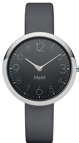
Referenz: M11944-846 Größe: Ø 34 mm Uhrwerk: Quarzwerk Gehäuse: Edelstahl, poliert Band: Leder, dunkelgrau Zifferblatt: anthrazit Wasserdicht: 3 ATM UVP: 139,00 Euro