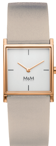
Referenz: M11974-792 Größe: 21x21mm Uhrwerk: Quarz Gehäuse: Edelstahl, IP rose, poliert Band: Leder, nude Zifferblatt: silber Wasserdicht: 3 ATM UVP: 179,00 Euro