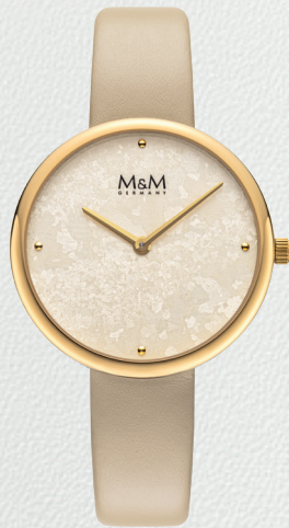
Referenz: M11978-532 Größe: Ø 34 mm Uhrwerk: Quarz Gehäuse: Edelstahl, IP gold, poliert Band: Leder, beige Zifferblatt: crystal beige Wasserdicht: 3 ATM UVP: 169,00 Euro