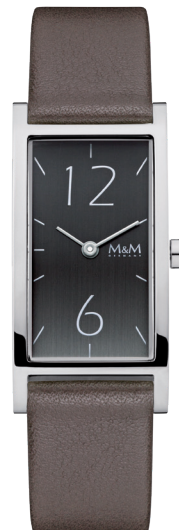
Referenz: M11918-847 Größe: 42 x 20 mm Uhrwerk: Quarz Gehäuse: Edelstahl, poliert Band: Leder, graphit Zifferblatt: anthrazit Wasserdicht: 3 ATM UVP: 139,00 Euro