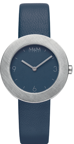
Referenz: M11959-827 Größe: Ø 34 mm Uhrwerk: Quarz Gehäuse: Edelstahl, kratzmatt Band: Leder, dunkelblau Zifferblatt: dunkelblau Wasserdicht: 3 ATM UVP: 119,00 Euro