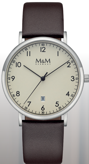
Referenz: M11970-527 Größe: Ø 40 mm Uhrwerk: Quarz Gehäuse: Edelstahl, matt Band: Leder, dunkelbraun Zifferblatt: creme Wasserdicht 3 ATM UVP: 149,00 Euro